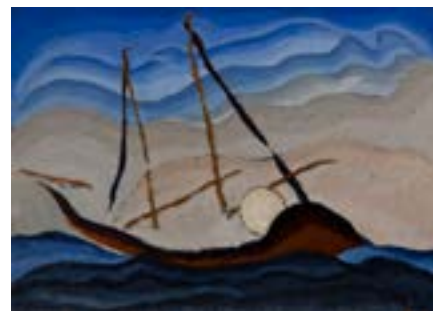
Arthur Dove, Boat Going Through Inlet , 1929