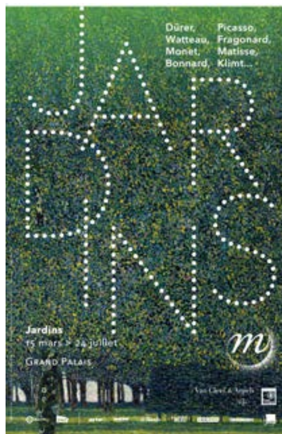
Affiche de l'exposition Jardins, Grand Palais, 2017