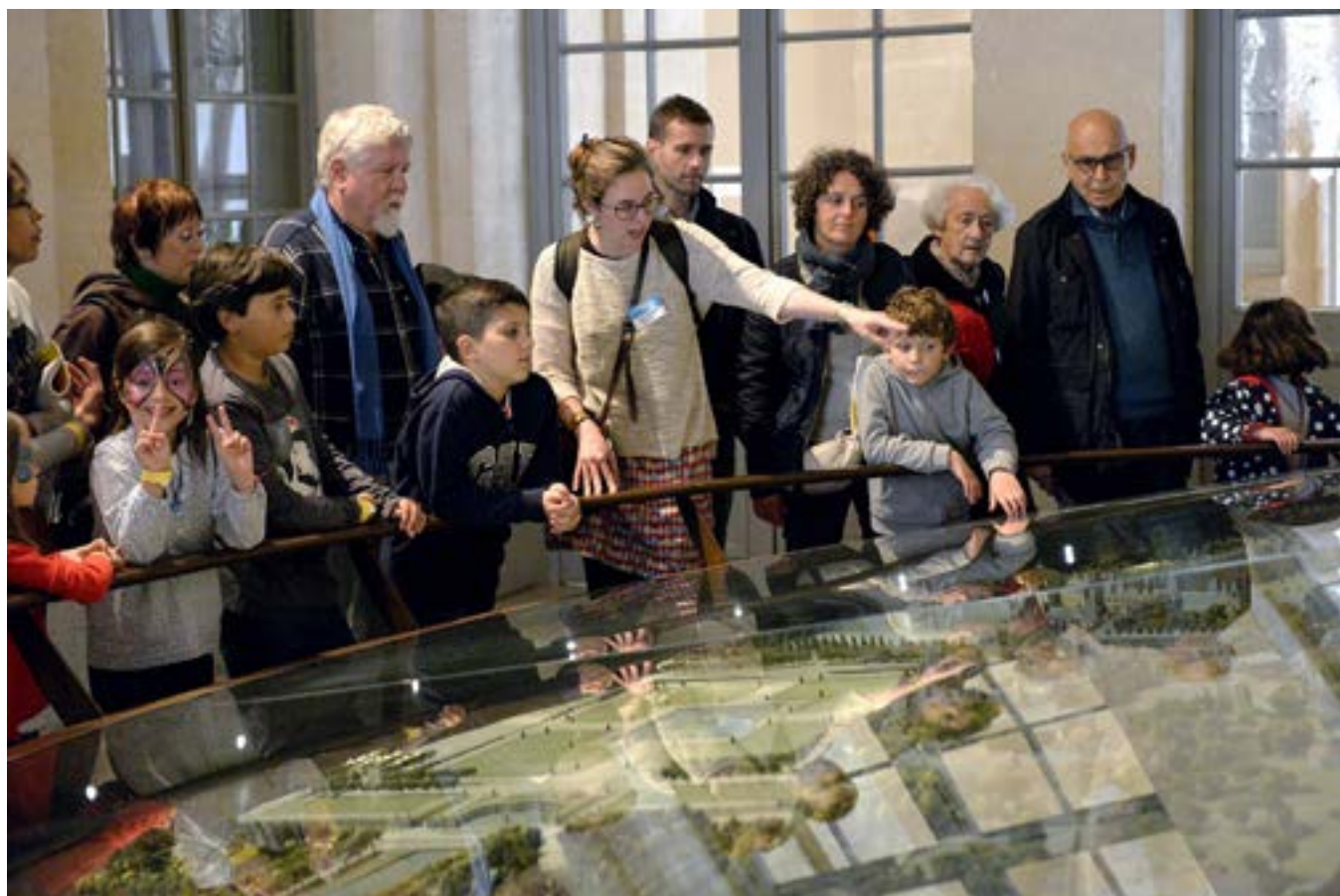
6 e édition du Festival de l'histoire de l'art

100 occasions de mieux connaître Fontainebleau