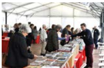
Salon du livre et de la revue d'art 6 e édition du Festival de l'histoire de l'art