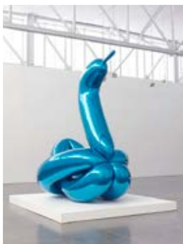
Jeff Koons, Balloon Swan Blue © Jeff Koons