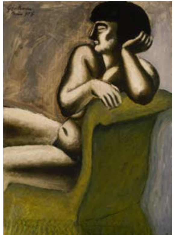
John Graham, The Green Chair , 1928 Oil on canvas

En lien avec le thème de la nature, cette édition de l'Université de printemps s'intéressera au corps humain , à la fois partie prenante de la condition humaine et la dépassant par la représentation artistique qui ne cesse de le recréer. Depuis les empreintes, les tracés digitaux et les dessins au doigt retrouvés dans les grottes du monde entier, jusqu'à la peinture, la photographie, la sculpture, la performance, le vêtement et la danse, le corps et l'art ont partie liée . Historiens de l'art, pédagogues, scientifiques et spécialistes des arts du corps et du mouvement croiseront donc leurs regards autour de ce triple statut du corps : objet, outil et sujet de l'art , afin d'aider les enseignants à former le regard des élèves à la diversité des représentations et à leurs variations dans l'espace et dans le temps. Enfin, cette édition ne manquera pas de poser la question de cet impensé que constitue le corps de l'élève – à la fois si présent à l'école et si absent de la pensée scolaire – pour l'émouvoir et le mettre en mouvement.