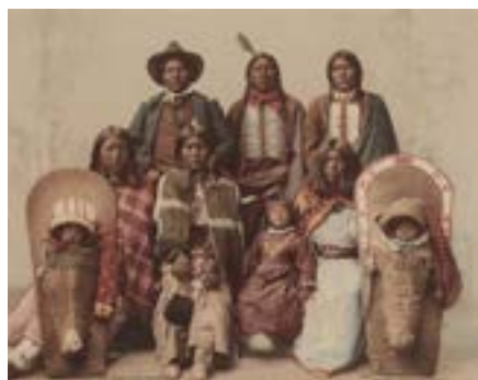
Detroit Photographic Co., Ute Chief Sevara and Family, 1899 Gift of Mary and Dan Solomon Courtesy National Gallery of Art, Washington