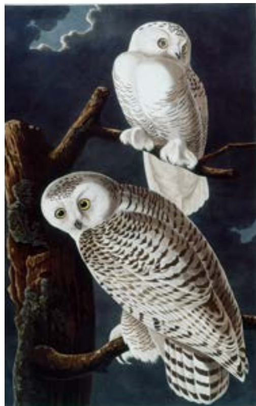
John James Audubon (1785-1851), The Birds of America, snowy owl [harfang des neiges], 1831