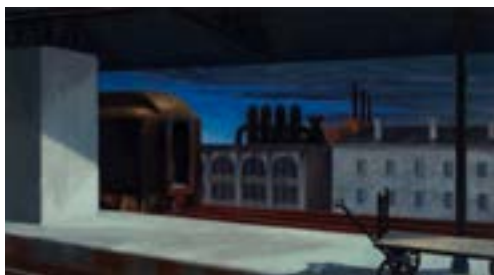
Edward Hopper, Dawn in Pennsylvania 1942