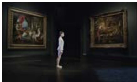
National Gallery de Frederick Wiseman