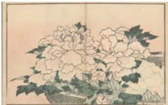
Katsushika Hokusai, Album de dessins d'après nature