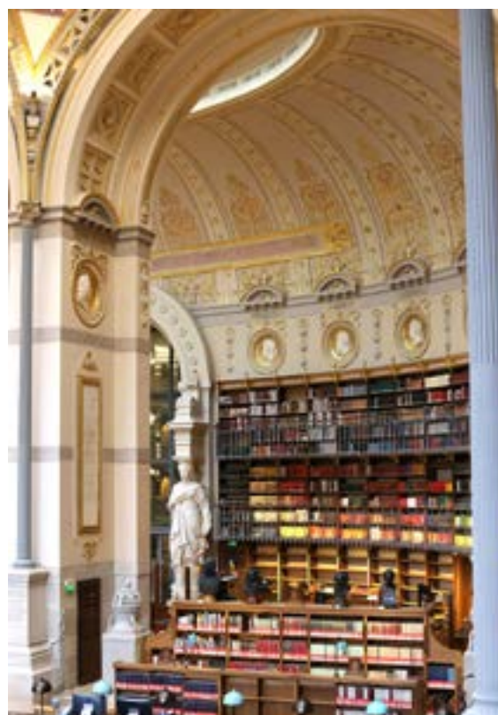
Bibliothèque Labrouste, 2016