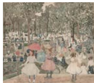
Maurice Brazil Prendergast (1858 - 1924) The Mall, Central Park, 1900/1903