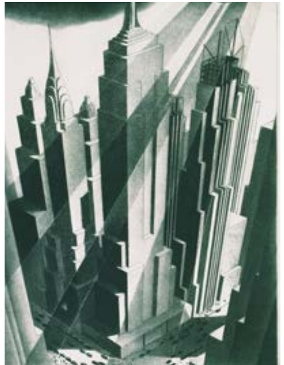
Samuel L. Margolies, Man's Canyon , 1936 © Terra Foundation for American Art, Daniel J. Terra Collection, 1946.41