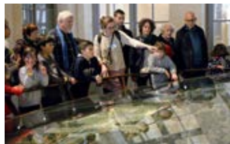
Visite guidée, 6 e édition du Festival de l'histoire de l'art