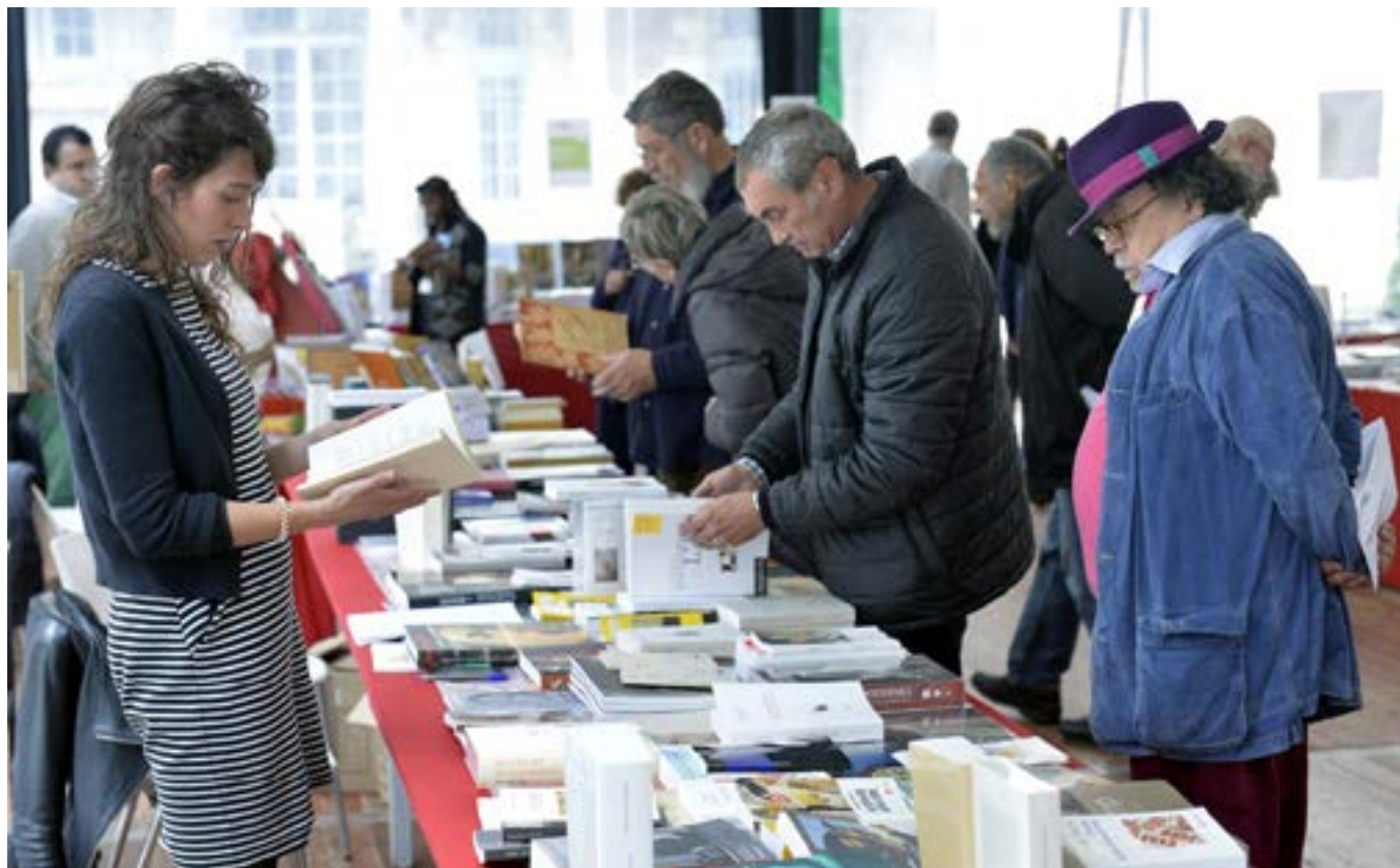
Jean-Michel Ribes au Salon du livre et de la revue d'art - 6 e édition du Festival de l'histoire de l'art

Succès répété d'année en année, le Salon du livre et de la revue d'art plante sa tente dans la cour ovale du château de Fontainebleau afin de présenter au public un panorama de l'actualité éditoriale, du livre d'art à la revue savante en passant par les essais sur l'art, les publications de thèses ou les livres jeunesse.