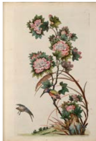
Gabriel Huquier (XVIII e siècle), Livre des différentes espèces d'oiseaux, fleurs, plantes et trophées de la Chine