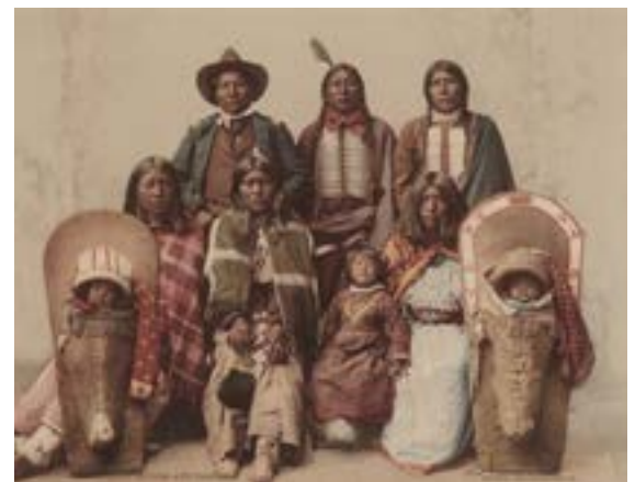
American 19th Century (Detroit Photographic Co.) Ute Chief Sevara and Family, 1899 Gift of Mary and Dan Solomon