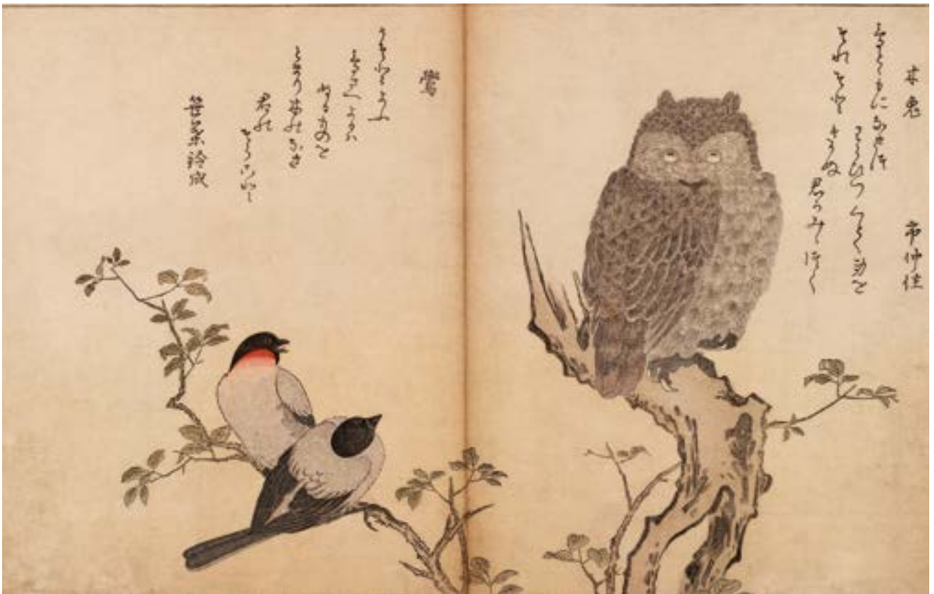
Kitagawa Utamaro. Myriades d'oiseaux (v. 1790).

Le Festival de l'histoire de l'art propose d'explorer le thème de la nature dans ses aspects les plus variés. La notion de nature sera entendue dans son sens large, comme l'ensemble des êtres et des réalités qui environnent l'Homme mais ne sont ni créés, ni organisés par lui. Comme telle, la nature englobe une grande partie de l'activité scientifique, investit la pensée mythico-religieuse, stimule l'imaginaire et sert de référence à l'esthétique, sans omettre la quête de fusion liée à l'animisme / Gaïa.