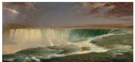
Frederic Edwin Church, 1826 - 1900 Niagara, 1857 Corcoran Collection (Museum Purchase, Gallery Fund)