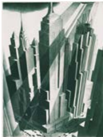
Samuel L. Margolies, Man's Canyon , 1936