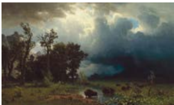
Albert Bierstadt (1830 - 1902), Buffalo Trail: The Impending Storm, 1869