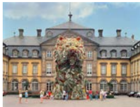
Jeff Koons, Puppy © Jeff Koons