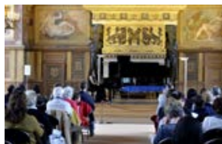
Concert - 6 e édition du Festival de l'histoire de l'art