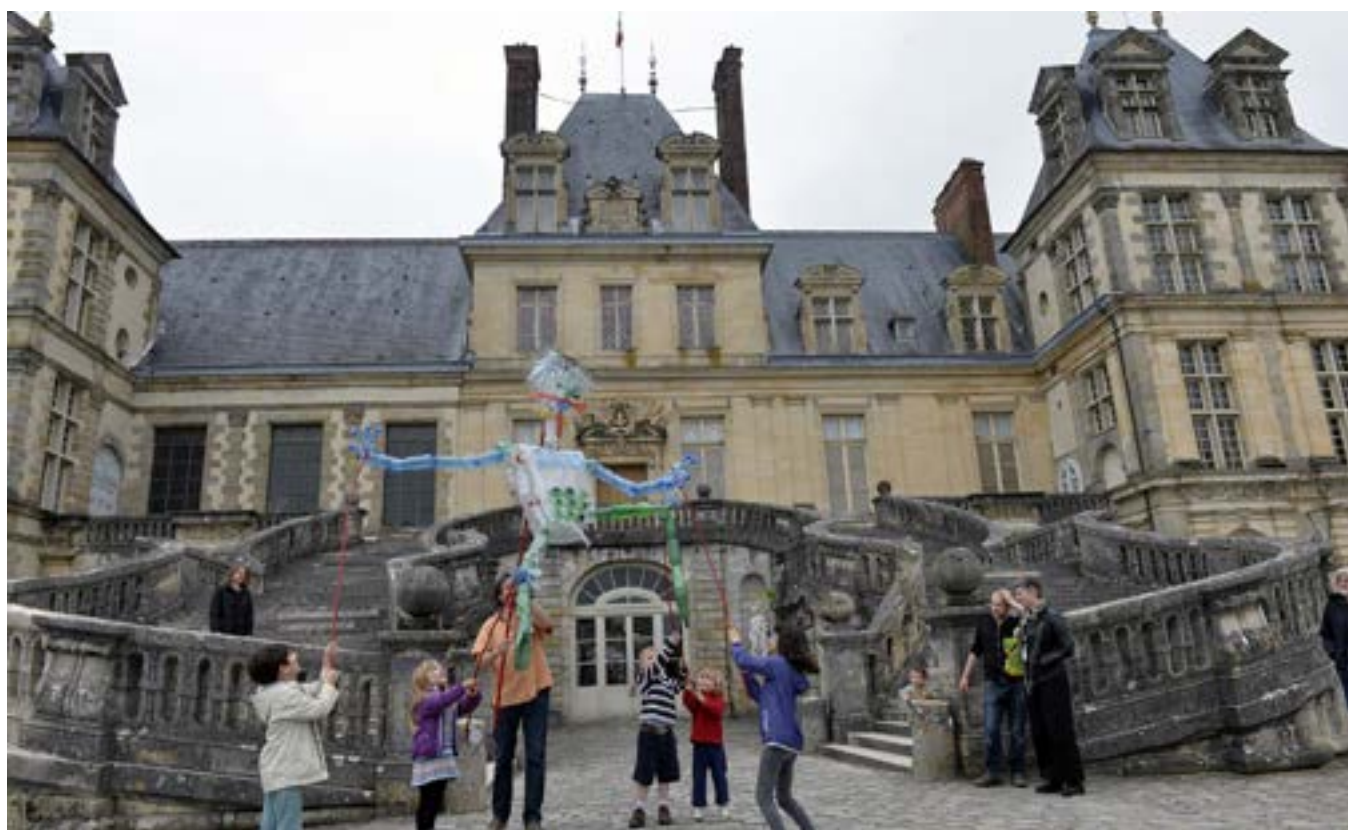
Ateliers pédagogiques- 6 e édition du Festival de l'histoire de l'art

Des visites et des ateliers de pratique artistique seront proposés aux familles et au jeune public sur les thèmes de la nature et des États-Unis. Les familles pourront notamment participer à des visites guidées entre conte et mythologie : « La ménagerie Royale », « Paroles d'arbres » ou encore « Mythes et forêt ». Des ateliers permettront également aux plus jeunes de s'initier au modelage, au Land art, et à la peinture végétale grâce à des animateurs du Muséum national d'histoire naturelle. Comme en 2016, une marionnette géante conçue et réalisée par des élèves pourra être manipulée à travers les cours et jardins par les enfants. Le célèbre jeu de paume de Fontainebleau proposera des démonstrations et des initiations au « jeu des rois, roi des jeux ». Un stand maquillage sera ouvert à tous les enfants qui pourront également louer des costumes dans les espaces d'accueil du château. Enfin, un livret-jeux spécialement conçu pour l'occasion sera offert aux enfants qui voudront découvrir de façon ludique l'extérieur du château.