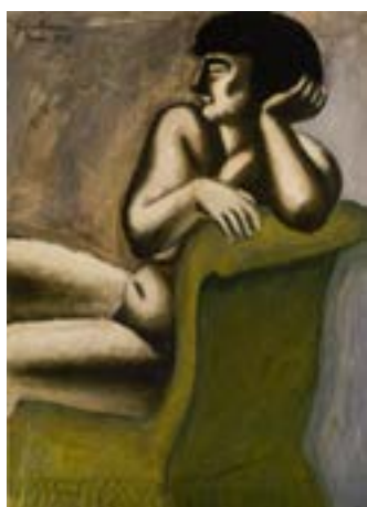
John Graham, The Green Chair , 1928