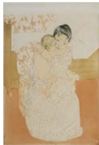
Mary Cassatt, Maternal Caress 1890-91