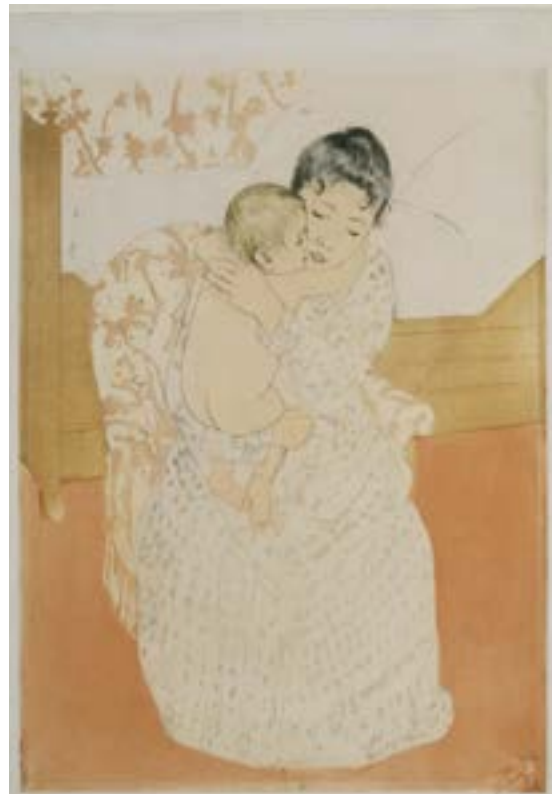
Mary Cassatt, Maternal Caress 1890-91 Drypoint, aquatint in color and softground etching Terra Foundation for American Art, Daniel J. Terra Collection, 1994.5

Les 2, 3 et 4 juin, à l'heure du brunch , les plus grands spécialistes vous inviteront à découvrir l'œuvre de trois artistes américains, parmi les plus célèbres aujourd'hui : Mary Cassatt , l'impressionniste américaine, amie de Degas ; Cy Twombly , actuellement célébré au Centre Georges-Pompidou, artiste singulier qui sut allier graffiti et abstraction, collage et mythologie, sans oublier Edward Hopper , auteur d'une vision insolite de la société américaine, à la fois mélancolique et cynique.