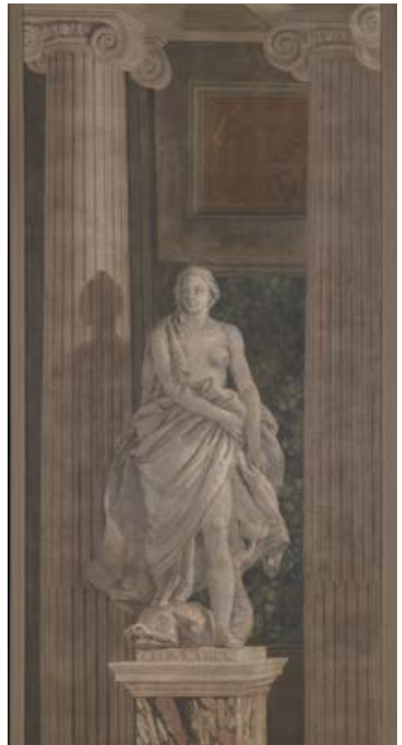
Giovanni Battista Tiepolo and Workshop, Geometry , 1760