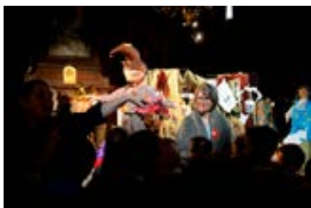
Ateliers pédagogiques- 6 e édition du Festival de l'histoire de l'art