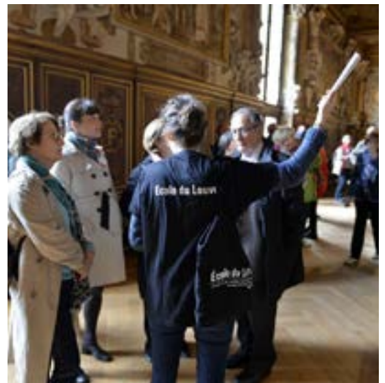
Visite guidée, 6 e édition du Festival de l'histoire de l'art