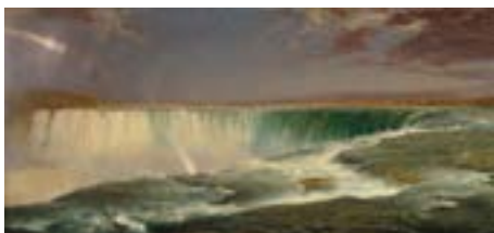
Frederic Edwin Church, 1826 - 1900 Niagara, 1857 Corcoran Collection (Museum Purchase, Gallery Fund)