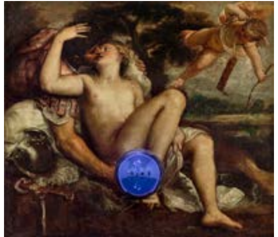
Jeff Koons, Gazing Ball Titian Mars Venus and Cupid © Jeff Koons

La galerie de portraits s'achèvera avec les portraits