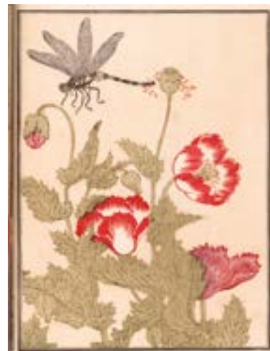
Kitagawa Utamaro, Album des insectes choisis . 1788