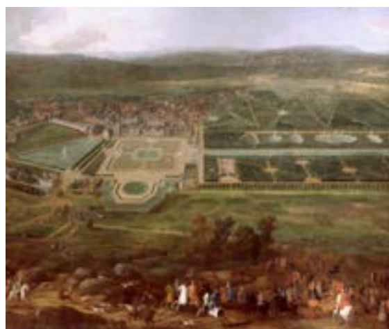
Vue du château et des jardins de Fontainebleau après les travaux de 1713 Pierre-Denis Martin