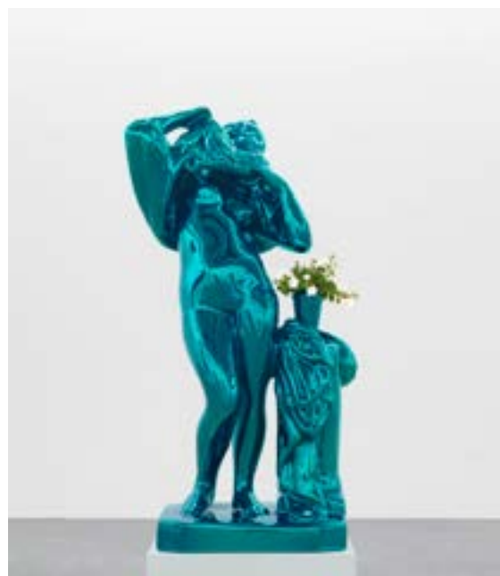
Jeff Koons, Metalic Venus Rome