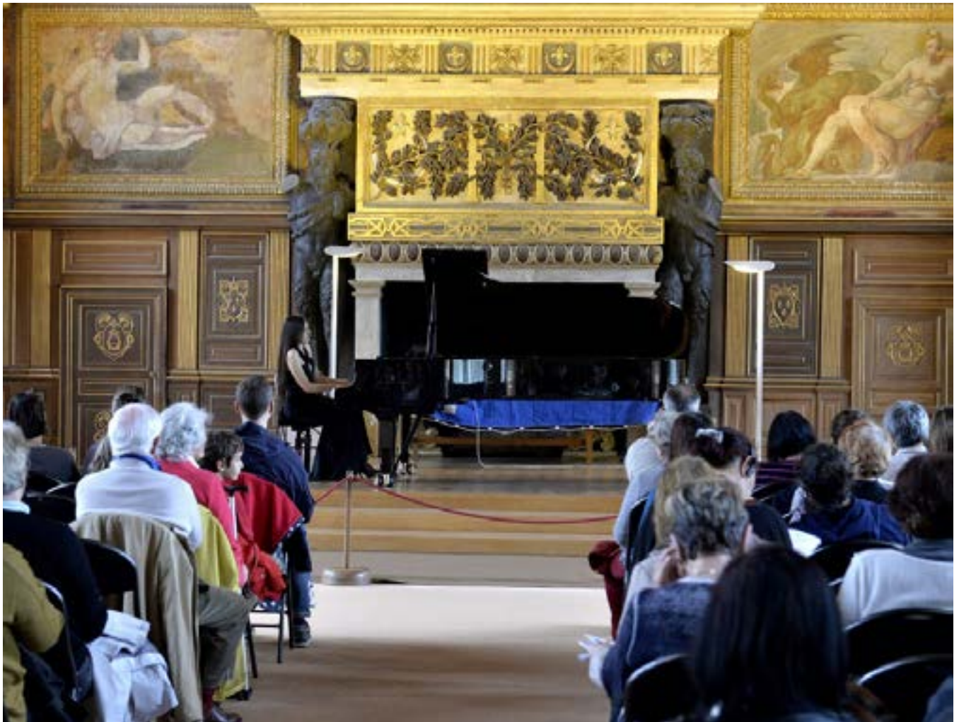
Ateliers pédagogiques- 6 e édition du Festival de l'histoire de l'art

Le Festival mettra à l'honneur des élèves du CNSMDP des départements « disciplines instrumentales classique et contemporaine » et « musique ancienne ». Ces concerts sont l'occasion pour le Conservatoire de manifester sa volonté de s'ouvrir au monde extérieur et de développer partenariats et contacts avec le public. Ils reflètent la diversité et l'excellence des activités pédagogiques de cette grande maison. Ce partenariat souligne la curiosité, l'initiative et le dynamisme au service de l'éclosion des grands talents de demain, plaisir que le Conservatoire est fier de partager avec le public du château de Fontainebleau.