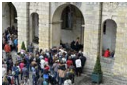
6 e édition du Festival de l'histoire de l'art