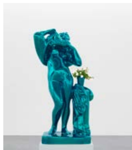
Jeff Koons, Metalic Venus Rome © Jeff Koons