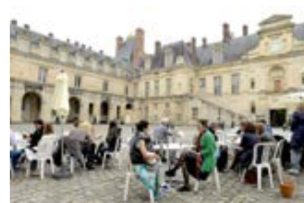
6 e édition du Festival de l'histoire de l'art