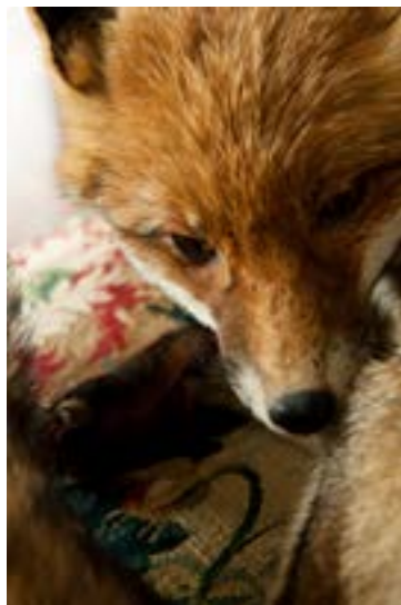
Salon Bleu Musée de la Chasse et de la Nature