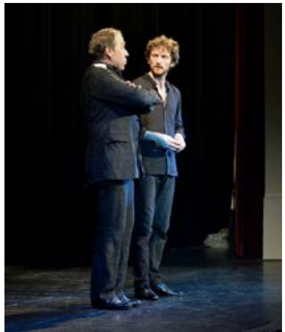
Le marathon du rire, 2016 6 e édition du Festival de l'histoire de l'art

L'appli du Festival est un développement proposé par Les Amis du Festival de l'histoire de l'art.