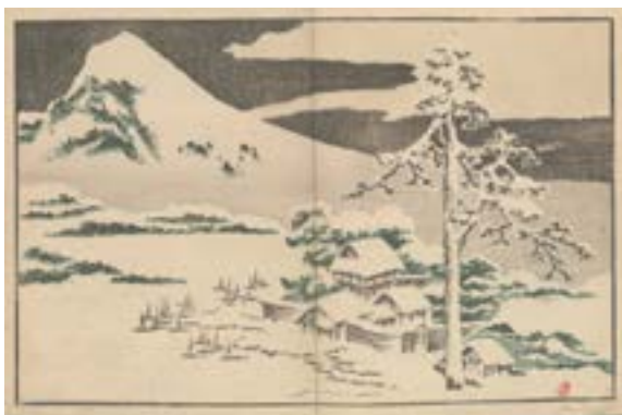
Katsushika Hokusai, Album de dessins d'après nature