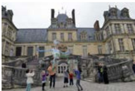
Ateliers pédagogiques - 6 e édition du Festival de l'histoire de l'art