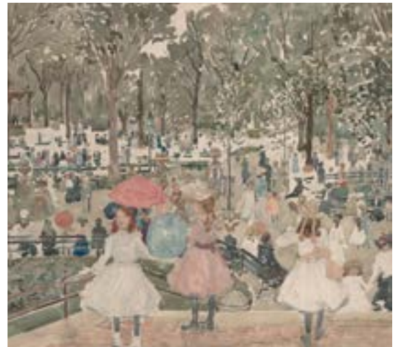
Maurice Brazil Prendergast (1858 - 1924) The Mall, Central Park, 1900/1903

Les liens entre le thème du Festival et le pays invité sont très forts cette année. Pays de grands espaces, les États-Unis ont une vision de la nature qui va du religieux au nationalisme en passant par l'écologie. La première école de peinture américaine peint des paysages, la Hudson River School . Le Festival s'intéressera particulièrement à la question de l'écologie dans l'art, depuis l'écologie gothique jusqu'au Land art .