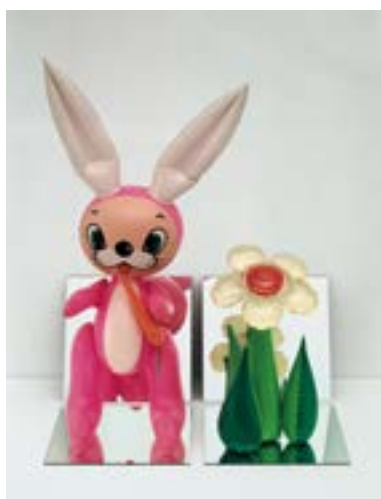
Jeff Koons, Bunny with flower © Jeff Koons