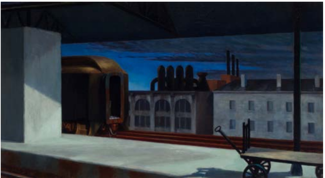
Edward Hopper, Dawn in Pennsylvania 1942