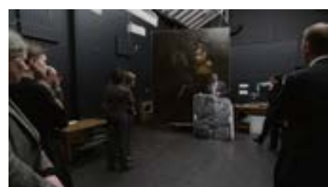
National Gallery de Frederick Wiseman