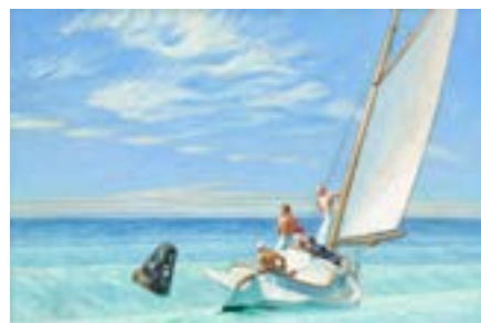
Edward Hopper, American, 1882 - 1967 Ground Swell, 1939 Corcoran Collection (Museum Purchase, William A. Clark Fund)