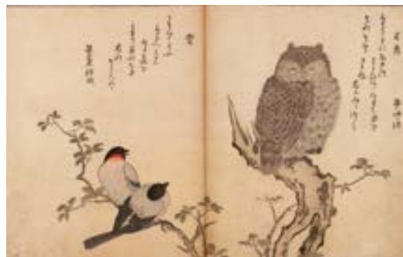
Kitagawa Utamaro. Myriades d'oiseaux (v. 1790).