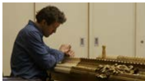
National Gallery de Frederick Wiseman