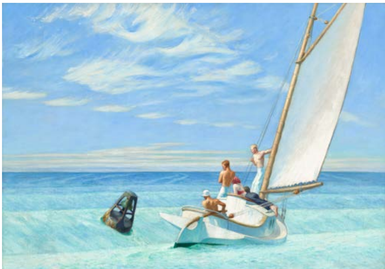
Edward Hopper (1882 - 1967), Ground Swell, 1939 Corcoran Collection (Museum Purchase, William A. Clark Fund)

Afin de rendre compte de la vitalité de l'histoire de l'art aux États-Unis, les principales institutions de recherche en histoire de l'art, the Clark Art Institut, the Center for Advanced Study in Visual Arts (CASVA) at the National Gallery of Art ou encore le Getty Research Institute, les universités, comme les musées, petits ou grands, du Metropolitan Museum of Art au Museum of Modern Art (MoMA), du Crystal Bridges au Whitney Museum, participeront au Festival à des titres divers.