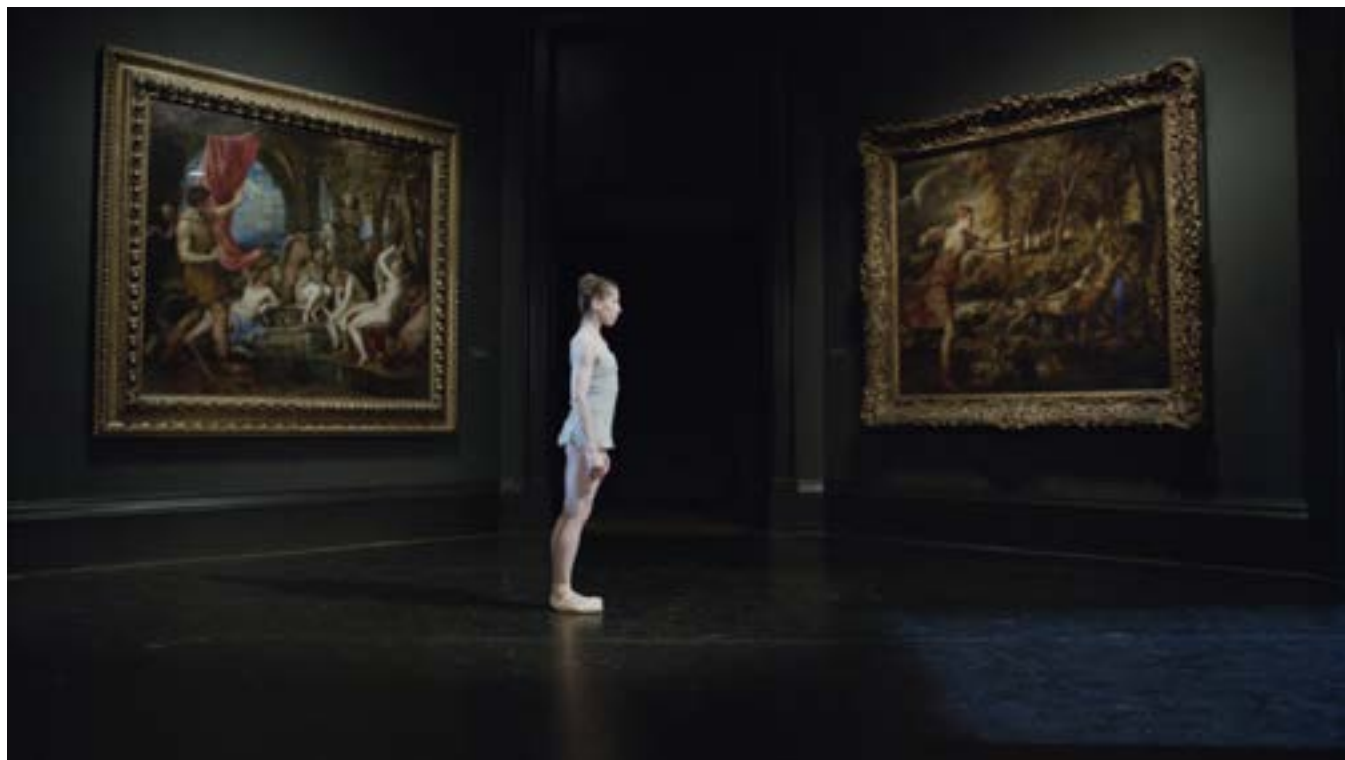
National Gallery de Frederick Wiseman

Une rétrospective des films sur l'art de Frederick Wiseman nous rappellera comment, par son observation minutieuse et approfondie des institutions artistiques, ce réalisateur interroge les grands enjeux - politiques, économiques, sociaux, artistiques - de la création et de la diffusion des œuvres.