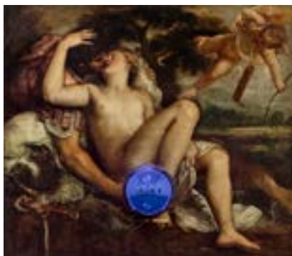
Jeff Koons, Gazing Ball Titian Mars Venus and Cupid © Jeff Koons