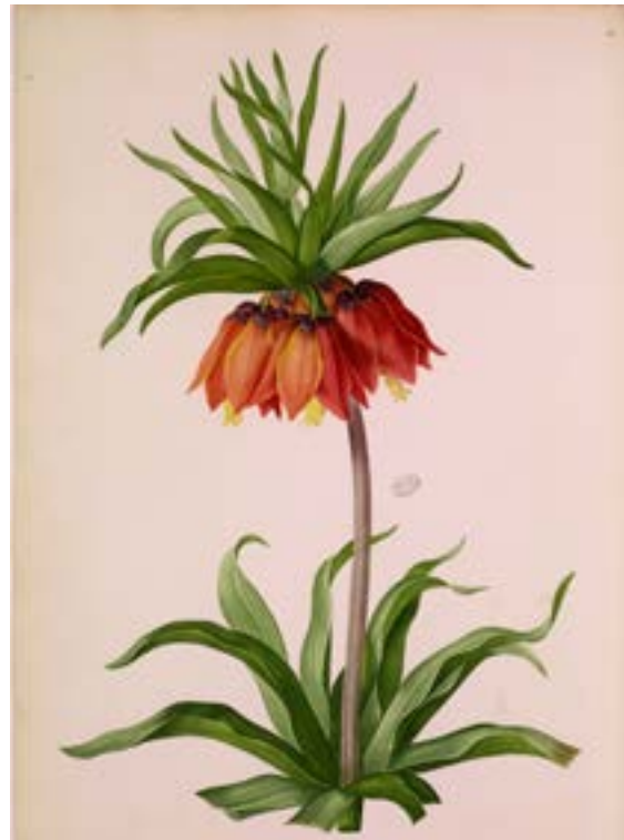
Pierre Joseph Redouté (1759-1840), Fritillaire impériale / Fritillaria imperialis, 1802-1816, Paris

Le Festival reviendra sur le rôle des bibliothèques, lieu et objet de recherche, ainsi que sur les ouvrages publiés à l'occasion de l'installation dans la salle Labrouste de la bibliothèque de l'Institut national d'histoire de l'art.